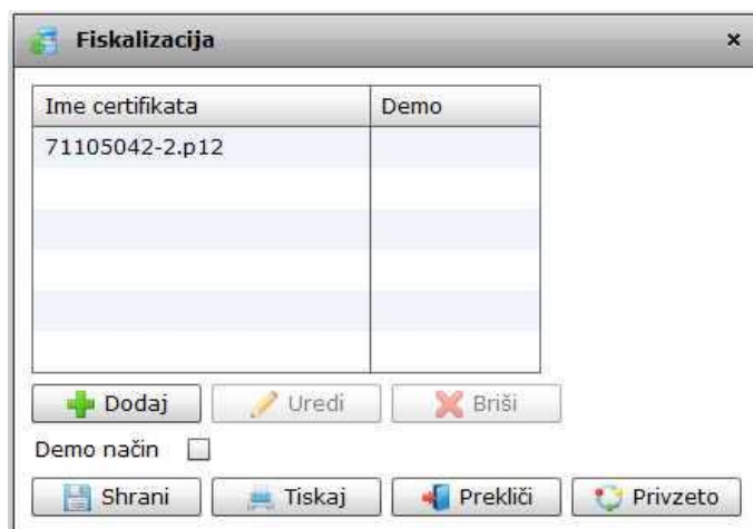
Slika št. 2 – Pregled certifikatov

Ko prejmemo certifikat, za davčno blagajno, ga je potrebno naložiti v program. To naredimo pod menijem Svn fiskalizacija. Ko se nam odpre okno na sliki št. 2 , kliknemo na gumb dodaj in odprlo se bo okno na sliki št. 3